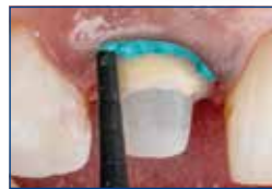
Fácil aplicação no sulco